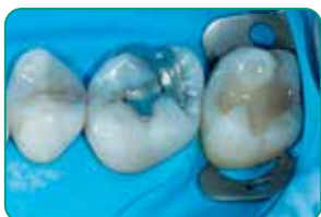
Cortesía de Dr Javier Tapia Guadix, España

Gracias a su tixotropía óptima, everX Flow se adapta fácilmente a cualquier preparación y evita la aparición de burbujas . Su fluidez controlada le permite su colocación en los molares superiores sin que se caiga o se descuelgue .