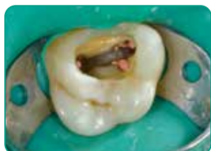
Preparación de la cavidad