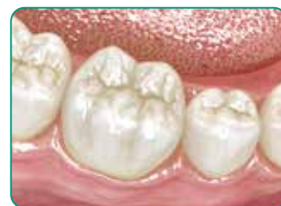
Resultado final tras cubrir con un composite convencional