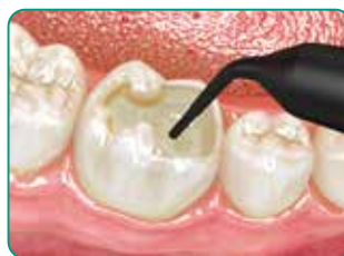
Rellene la cavidad con everX Flow