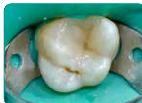
Capa final con G-aenial Universal Injectable (color A3)