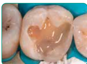
Aplicación de everX Flow (color Dentin)