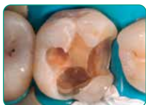
Preparación de la cavidad