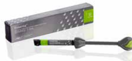
Essentia Universal Composite Universal en pasta

everX Flow, Essentia, G-Premio BOND y G-aenial Universal Injectable son marcas registradas de GC. Filtek Bulk Fill Flowable, SDR flow+ y Tetric EvoFlow Bulk Fill no son marcas registradas de GC.