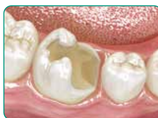
Prepare la cavidad

Color Dentin resultados altamente estéticos