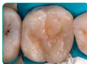
Capa final con Essentia (color Universal)