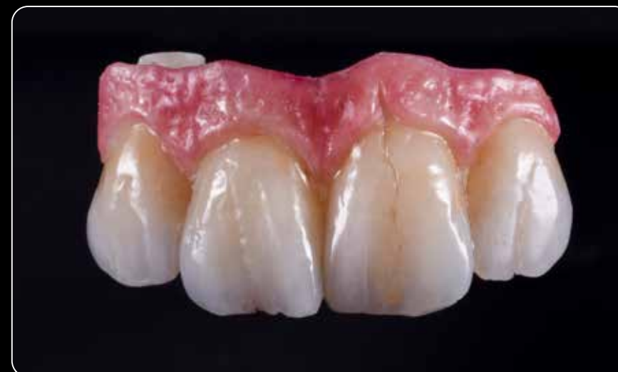
Estética en rojo y blanco