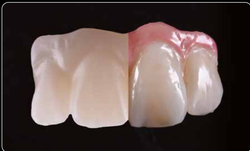
Estética máxima dentro de una microcapa